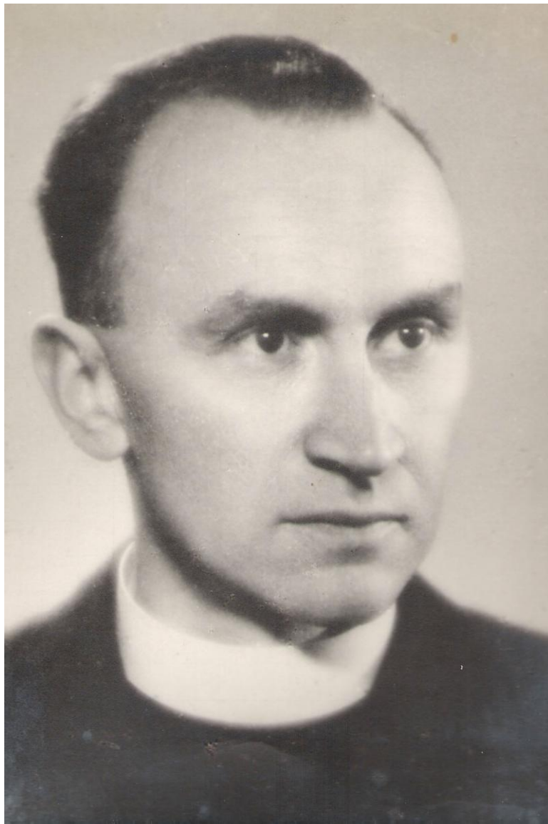
Kozmický dp farář v r. 1955