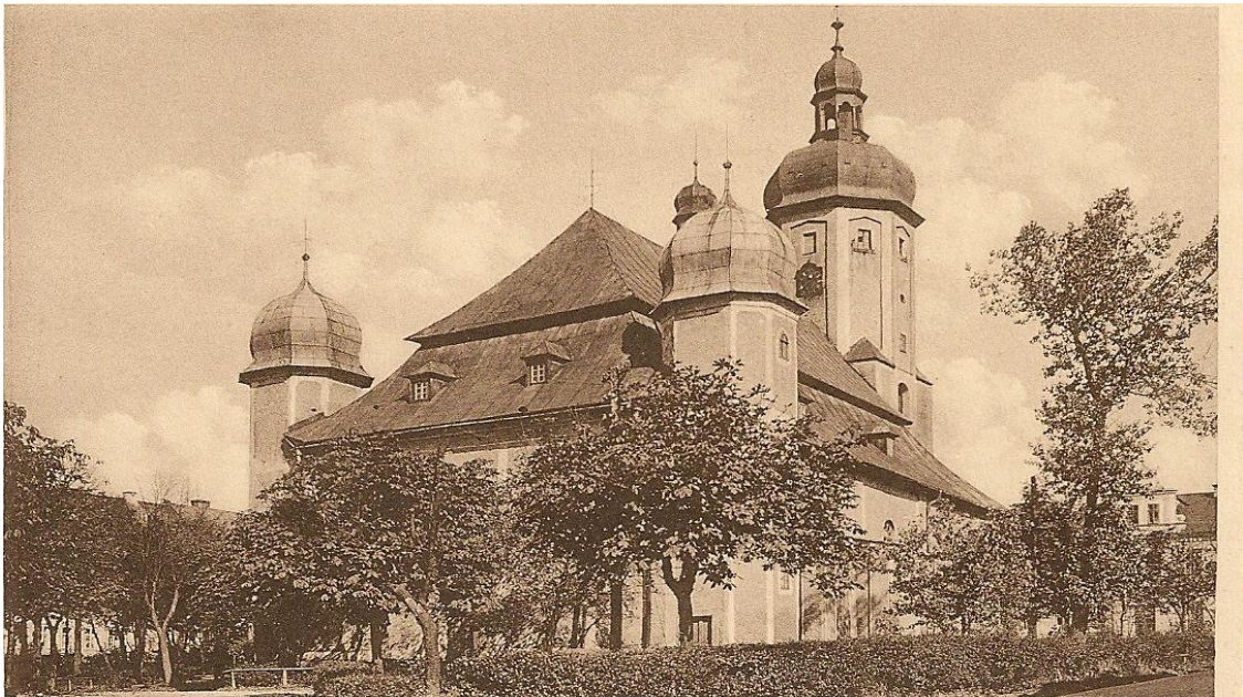
Bergstadt Platten. Kirche.